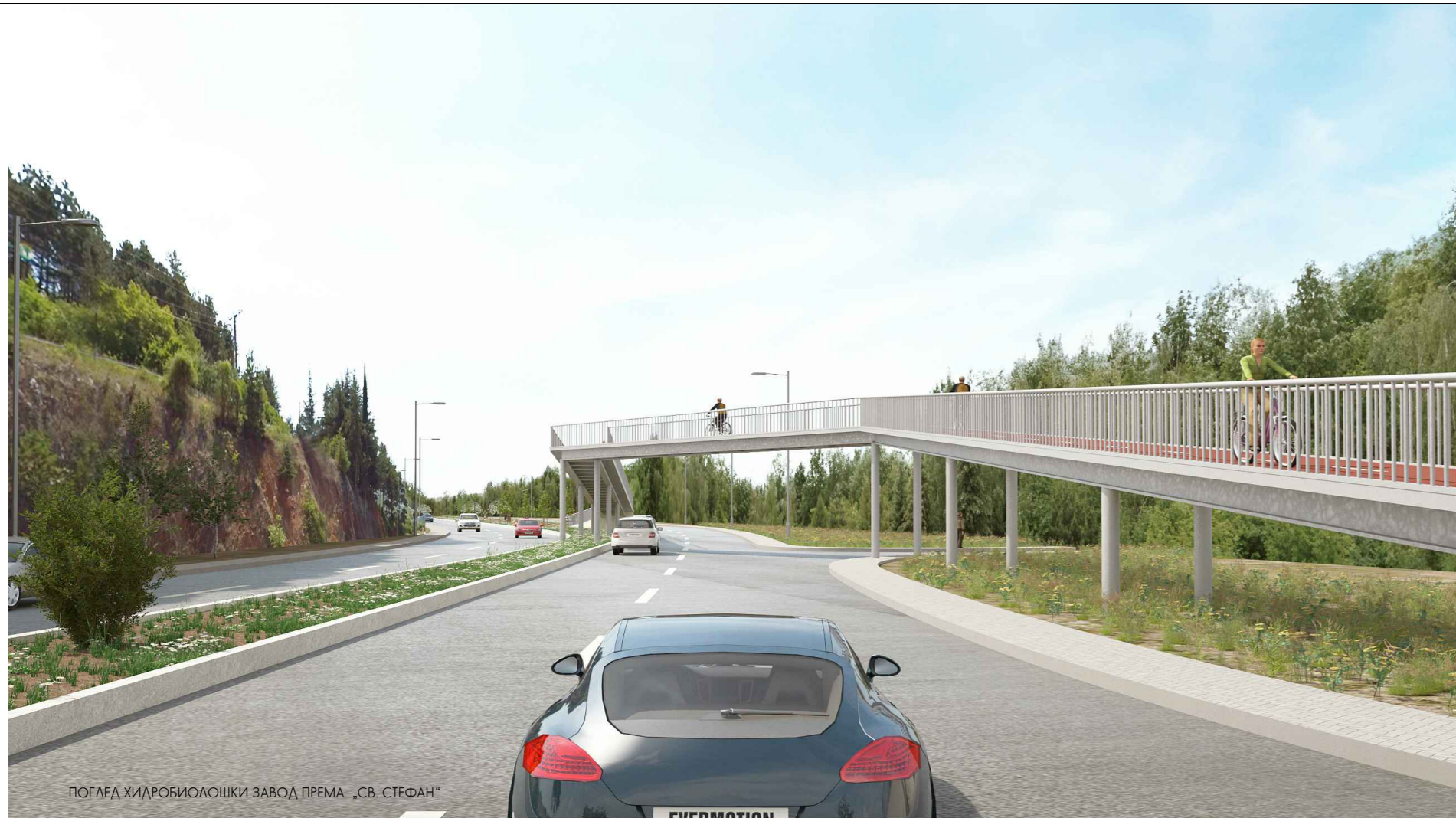
ПОГЛЕД ХИДРОБИОЛОШКИ ЗАВОД ПРЕМА „СВ. СТЕФАН“