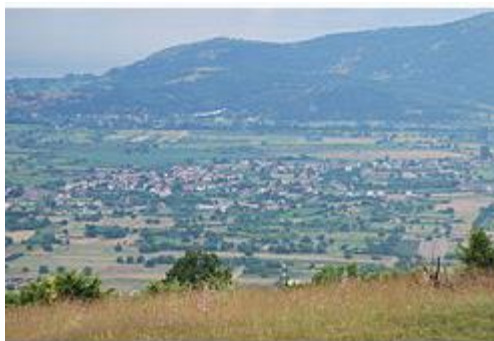
Панорама на Лескоец

Селото Лескоец се наоѓа на 4,1 км. оддалеченост од Охрид и во моментот представува приградска населба на градот Охрид, со развиена индустриска зона и голем број на мали и средни капацитети. Селото