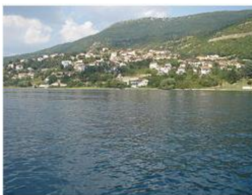
Глетка на Долно Коњско од водите на Охридското Езеро

Долно Коњско се наоѓа јужно од градот Охрид, над патот Охрид - Св. Наум и во непосредна близина на Охридското Езеро. Оваа населба е оддалечена на 5 км од градот Охрид.