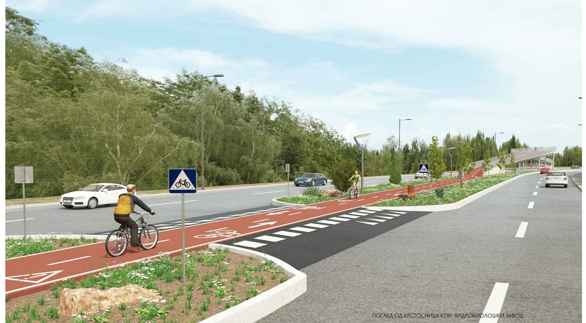
ПОГЛЕД ОД КРСТОСНИЦА КОН ХИДРОБИОЛОШКИ ЗАВОД