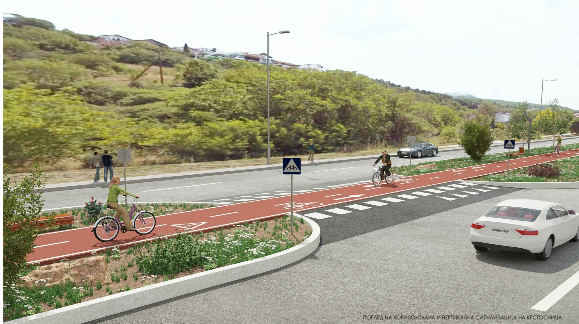
ПОГЛЕД НА ХОРИЗОНТАЛНА И ВЕРТИКАЛНА СИГНАЛИЗАЦИЈА НА КРСТОСНИЦА