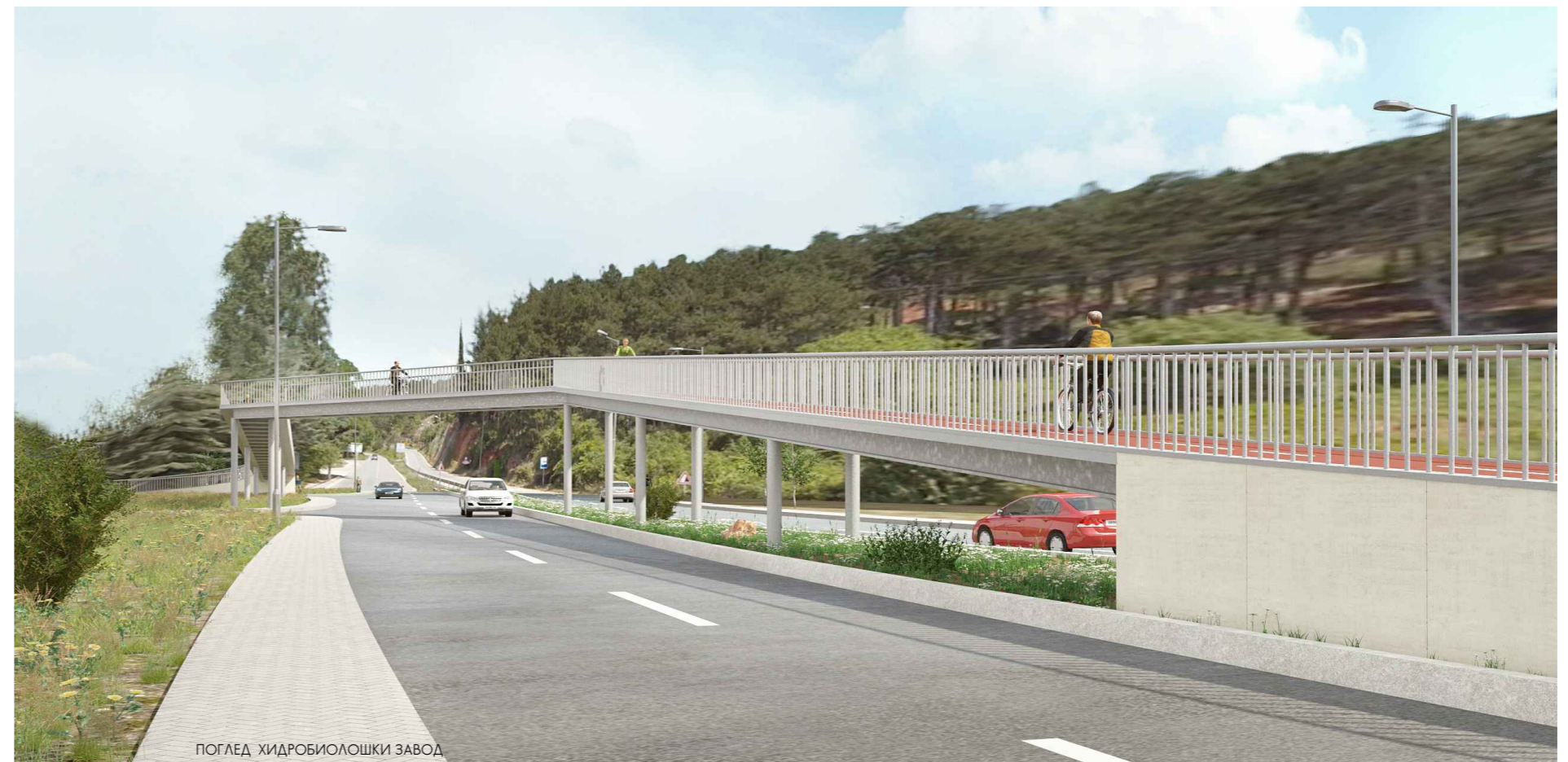
ПОГЛЕД ХИДРОБИОЛОШКИ ЗАВОД