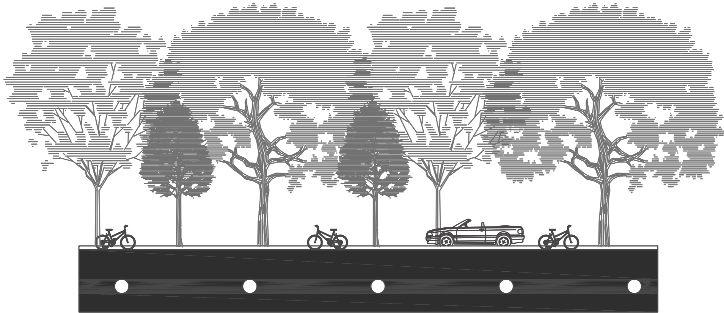
НАДОЛЖЕН КАРАКТЕРИСТИЧЕН ПРЕСЕК 1:100