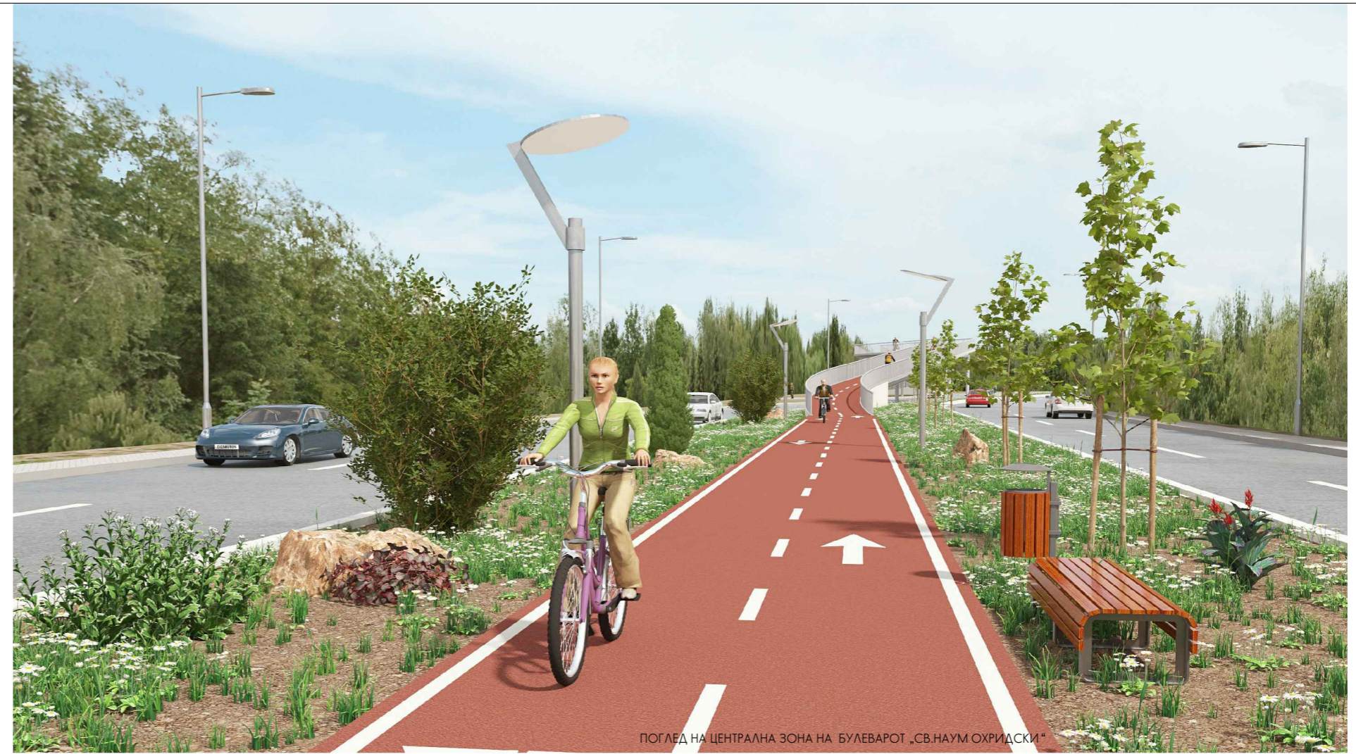
ПОГЛЕД НА ЦЕНТРАЛНА ЗОНА НА БУЛЕВАРОТ „СВ. НАУМ ОХРИДСКИ“