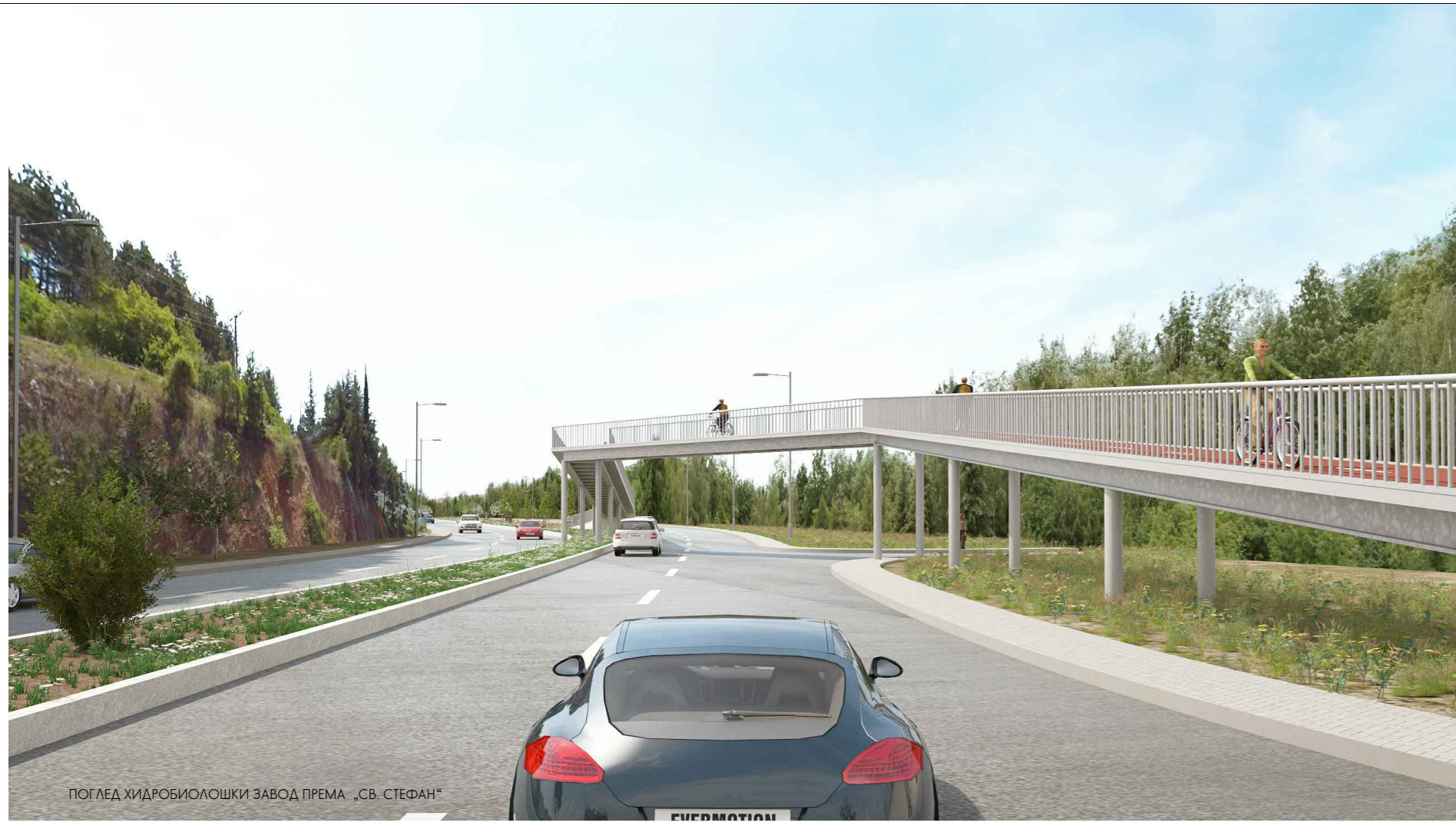
ПОГЛЕД ХИДРОБИОЛОШКИ ЗАВОД ПРЕМА „СВ. СТЕФАН“