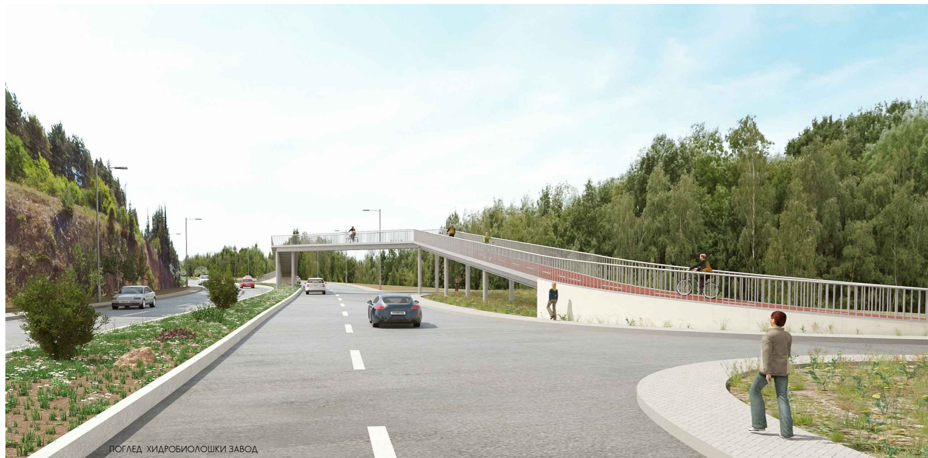
ПОГЛЕД ХИДРОБИОЛОШКИ ЗАВОД